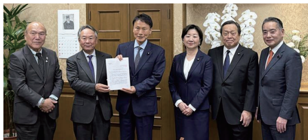
三反園訓 財務大臣政務官(左から3番目)

野田会長は、世帯構成の7割を占める単身・2人世帯の増加を指摘。「実態とそぐわないローンの問題を解決するため規制を緩和したい」と述べた。続いて松永幸久幹事長が、住宅ローン減税の延長と床面積要件の「40㎡」への緩和を要望。併せて、期限を迎える財務省所管の国税にかかる各種不動産税制特例の継続を求めた。