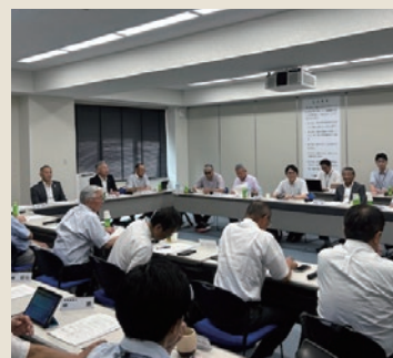
要望事項選定会議の様子