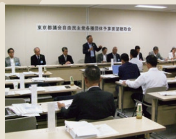
ヒアリングの様子