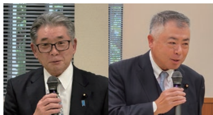
富樫博之 衆議院議員 櫻井充 参議院議員

続いて中村会長が挨拶に立ち、不動産価格の高騰を受けた既存住宅の流通の伸びと今後の課題などについて言及し、要望の中でも住宅ローン減税の拡大は住宅政