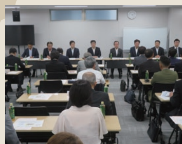
7支部役員と公明党愛知県本部幹部による意見交換会