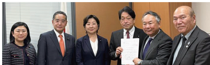
小野寺五典 自民党税制調査会長(右から3番目)

中村会長から挨拶がなされた後、松永幹事長より不動産流通市場に大きく影響を与える住宅ローン減税の延長とその適用要件である床面積の緩和、各種不動産税制にかかる特例措置の延長と拡充を要望した。併せて、今は新築住宅の価格が高く、スクラップアンドビルドの時代ではなくなっているため、世帯人数の状況や家族構成に応じた住まいの買い換え等を踏まえた、既存住宅の住宅ローン減税について床面積「40㎡以上」、借入限度額・期間について新築と差が生じないように条件の緩和を要望した。