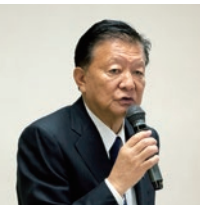
新藤義孝 自民党組織運動本部長