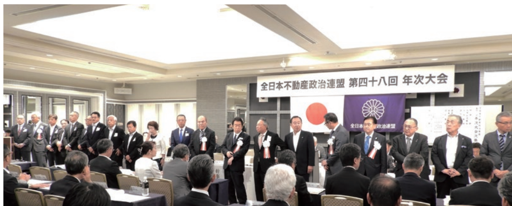
第23期新役員の幹事19名+監査役3名が決定